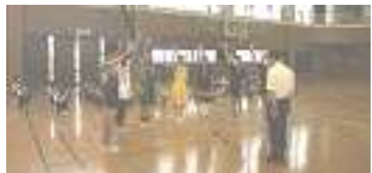
新人大会選手激励会 (9月19日)